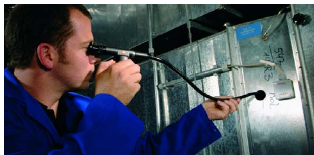
Проверка в воздуховодах с изогнутой трубкой, умеренной гибкости