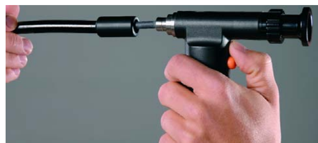
Различные трубки присоединяются простым вдавливанием