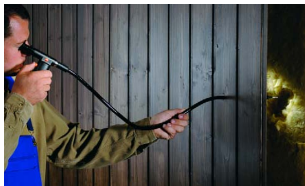
Проверка изоляции с использованием жесткой трубки