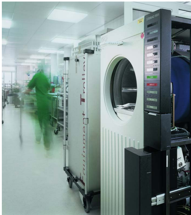
Производство стерильной продукции становится все более важным. С hygrotest 650 версия G8 H8, значения влажности и температуры в среде H_2O_2 могут измеряться непрерывно.

Роль стерилизации продуктов в процессах производства становится все более и более важной. Перекись водорода ( H_2O_2 ) - это вещество, используемое для этих целей, в основном, в процессе производства продуктов питания и напитков, а также в фармацевтической промышленности. H_2O_2 испаряется для поддержания стерильности продуктов в производственной камере. Для оптимального осуществления процесса, важно знать, и при необходимости регулировать, влажность в процессе стерилизации. Как правило, необходимо избегать конденсации паров H_2O_2 на стерилизуемых продуктах.