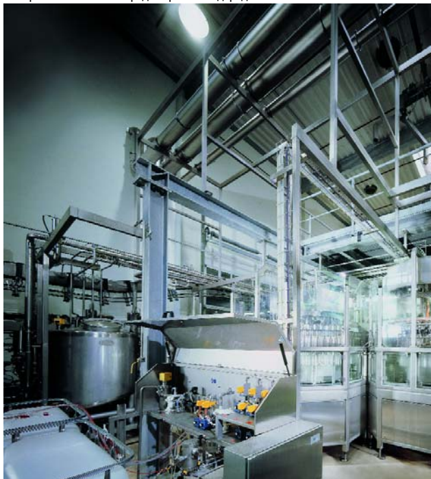
Сухая стерилизация выдвигает высокие требования к трансмиттеру влажности. hygrotest 650 версия G8 H8 работает оптимально в таких тяжелых условиях.

Измерение влажности в среде перекиси водорода