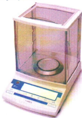
Рисунок 1 – Общий вид весов неавтоматического действия НТ

Принцип действия весов основан на преобразовании частоты вибрации акустического весоизмерительного датчика, возникающей при его растяжении или сжатии под действием взвешиваемого груза, в цифровой сигнал, изменяющийся пропорционально массе взвешиваемого груза. Результаты взвешивания выводятся на дисплей.